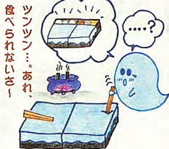
ツンツン…。あれ、食べられないさー！

んー、そういうわれますと、どれも一理ありますね。はがす・はがさない・破る・最初はがさないで後ではがす、いずれも大切なご先祖さまを敬つてのこと。一般的には、はがしてお供えするご家庭が多いようですが、重箱のラップの作法を語り合うことそのものが、立派な供養へとつながるのでしようね。さすがは、ご先祖さまを大切にす沖縄と、私も住職として深く感心させられているところです。